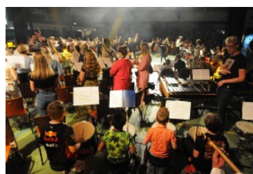
‘Time of My Life’ 13 juli Sportcentrum Leek